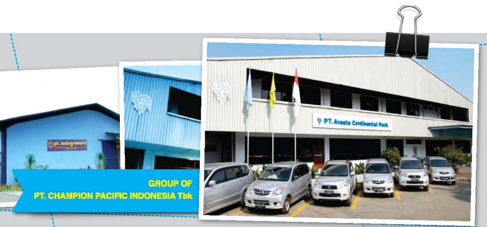
GROUP OF PT. CHAMPION PACIFIC INDONESIA Tbk

In October 2010, PT Kageo Igar Jaya Tbk changed its name to PT Champion Pacific Indonesia Tbk to mark the changes of its major share ownership composition. The changes in the composition of major share ownership were the result of the acquisition of 610,058,500 shares that represent 58.1% of ownership of PT Kalbe Farma Tbk in PT Champion Pacific Indonesia Tbk by PT Kingsford Holdings. The acquisition process was finalized between PT Kingsford Holdings and PT Kalbe Farma Tbk on August 12, 2010.