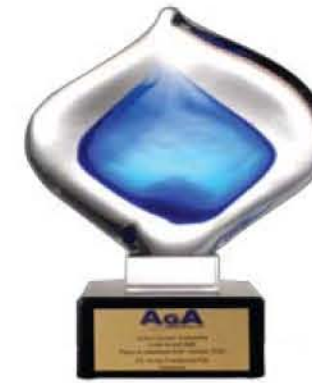
ASIAN GRAVURE ASSOCIATION Gold Awards: Paper & Aluminium Foil-Surface Print