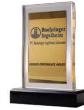
BOEHRINGER INGELHEIM Vendor Performance Award