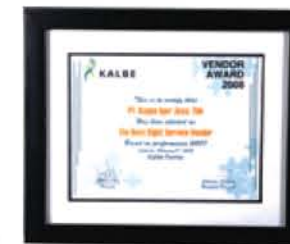
PT KALBE FARMA Tbk Vendor Performance Award Best Right Service Vendor