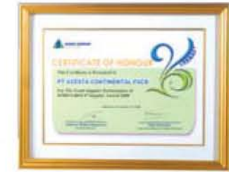
SOHO GROUP Certificated of Honour For The Good Supplier Performance of SOHO Group Supplier Award