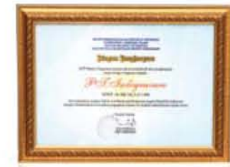
DEPARTEMEN KEUANGAN REPUBLIK INDONESIA Piagam Penghargaan