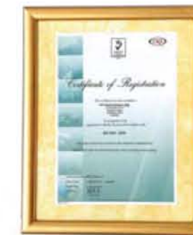
PT INDOGRAVURE ISO 9001:2008